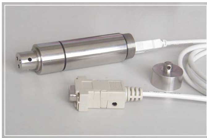
温湿度记录器与下载电缆连接