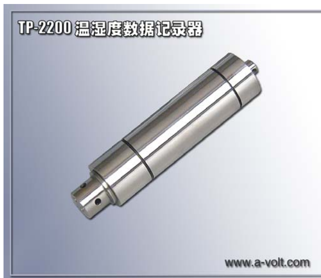
温湿度数据记录器外观

内置实时时钟,为每个温度记录提供精确定时,记录器的温度采集时间间隔可由用户自由设定,时间间隔从 10 秒至 7 天范围内可选,具有用户可编程的开始记录时间和在线实时温度监测功