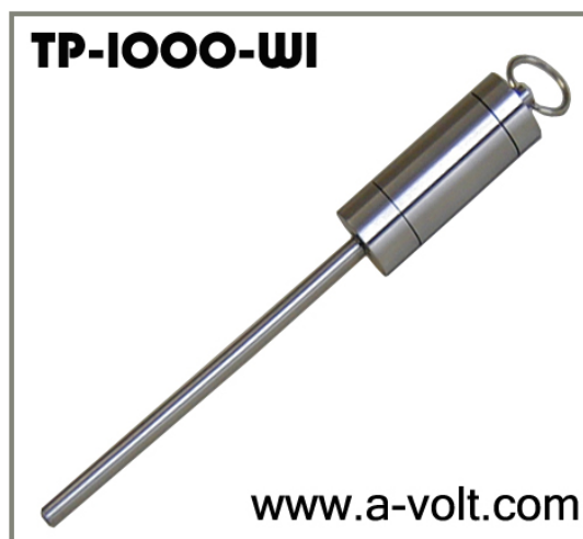
可防水的温度数据记录器

TP-1000-W1 温度数据记录器具有 32Kbyte 的非易失存储器，可记录高达 16000 个温度记录，记录器即使在电池耗尽