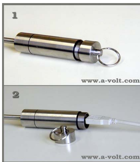
温度记录器与下载电缆连接